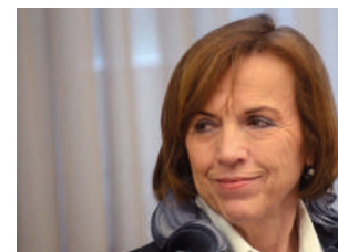
Elsa Fornero venerdì 17 / ore 18