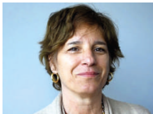
Maria Cristina Messa venerdì 17 / ore 10