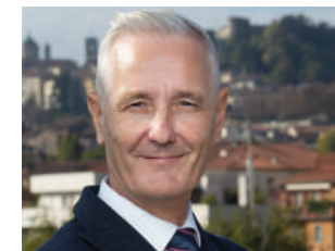
Giacinto Giambellini presidente Confartigianato Imprese Bergamo