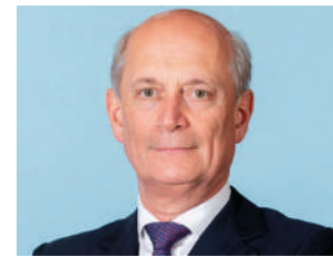
Carlo Mazzoleni presidente Camera di Commercio di Bergamo