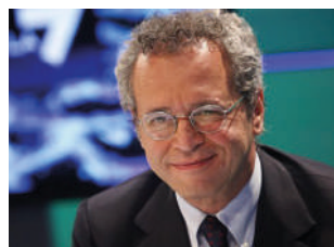
Enrico Mentana sabato 13 / ore 21.15