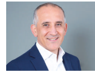
Renato Mazzoncini amministratore delegato e direttore generale A2A