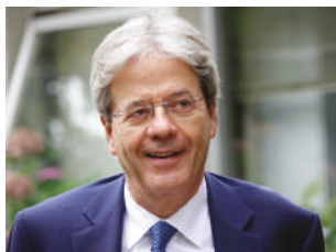
Paolo Gentiloni sabato 13 / ore 16.30