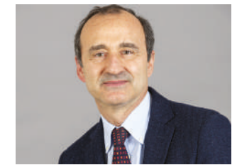
Stefano Scaglia presidente Confindustria Bergamo