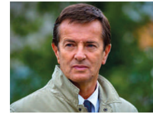
Giorgio Gori sindaco di Bergamo