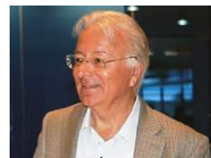
Federico Faggin venerdì 8 / ore 15