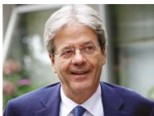
Paolo Gentiloni sabato 9 / ore 18