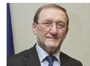
Paolo Malvestiti Presidente Camera di Commercio Bergamo