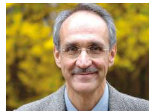
Pietro Ichino sabato 9 / ore 16.30

Luciano Fontana , direttore Corriere della Sera