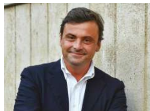
Carlo Calenda venerdì 8 / ore 18