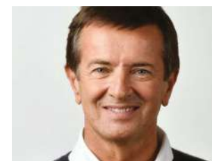
Giorgio Gori Sindaco di Bergamo