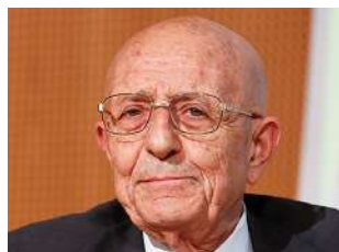
Sabino Cassese venerdì 13 / ore 11.30