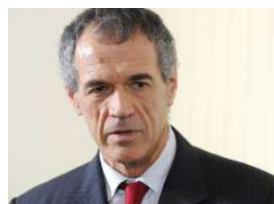
Carlo Cottarelli venerdì 13 / ore 16.30