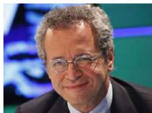
Enrico Mentana sabato 14 / ore 16.30