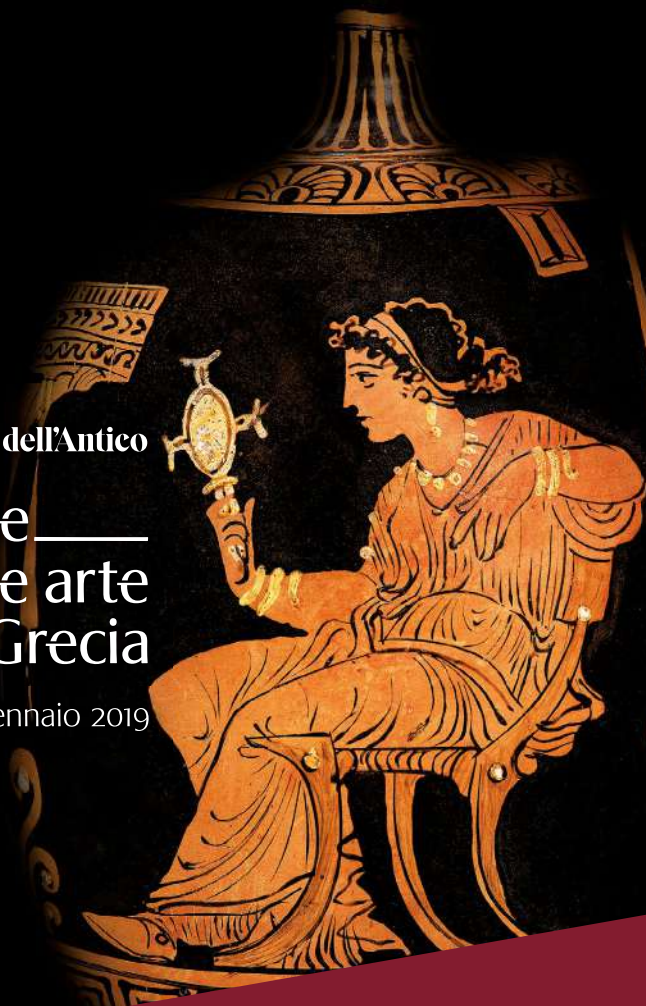
Leluthos, antichista apula a figure rosse, 370-360 a.C. Donna seduta su thronos con anello. Collezione Intesa Sanpaolo

Ceramiche, statue e oggetti d'uso quotidiano: il fascino della seduzione rivive in tutte le sue forme.